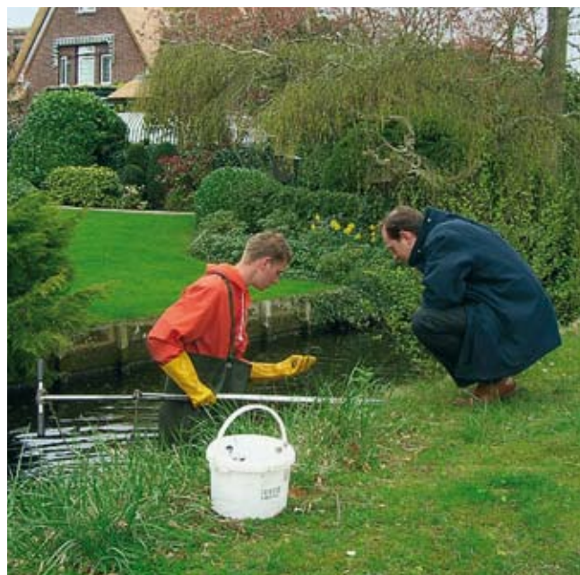
Er werd tot in de achtertuin gemeten.

schone bagger op de kant te ontvangen (ontvangstplicht). Maar, in veel gevallen is het vanwege bebouwing simpelweg niet mogelijk om bagger op de kant af te zetten. Van de ruim 128.000 m 3 uit klasse 0 - 2 kan er ruim 86.000 m 3 op de kant afgezet worden. Er blijft van deze klassen dus 42.000 m 3 over. Als we hier de 4.000 m 3 uit klasse 3 bij optellen moet er voor 46.000 m 3 een bestemming elders gevonden worden. In de loop van oktober is het mogelijk om via de website de gegevens per watergang op te vragen. De site zal ook achtergrondinformatie bieden om te begrijpen wat de gegevens betekenen.