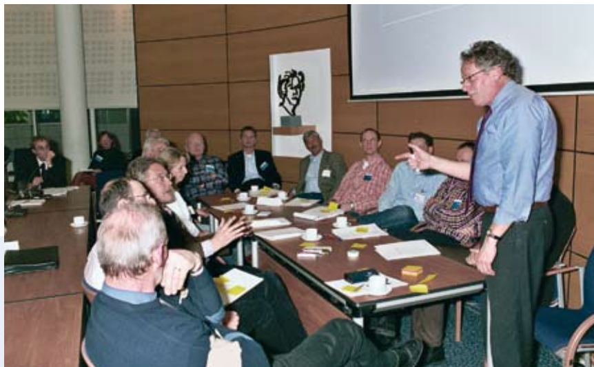
Rijnland stelt kritisch en constructief meedenken op prijs.

Verlagen van workshops, extra overleg en nog veel meer zijn te vinden op de website.